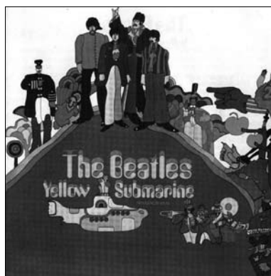
Imagen 4. Afiche del film Yellow Submarine , George Dunning, director, 1968

La presencia de tres tocadiscos portátiles o pickups en el afiche, enfatiza los cincuenta años del rock desde la perspectiva de la escucha. Lo que cuenta, entonces, es el uso, el consumo y la (re)significación local de un fenómeno internacional. Con el tocadiscos portátil, se inicia un tipo de audición independiente, que empiezan a realizar los (pre)adolescentes con un aparato económico, liviano y modular, que podían instalar con facilidad en sus dormitorios, muchas veces en el suelo. Por primera vez, los jóvenes podían sustraerse a la dominación paterna sobre el espacio sonoro doméstico, ejercida desde el control del gran equipo de música instalado en el living de la casa.