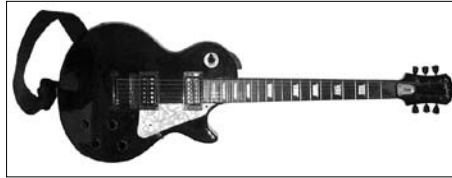
Imagen 8. Guitarra Epiphone, Les Paul Standar, Estados Unidos, 1952-1960

La paradoja es que, al igual que el LP fundacional de Los Mac's, lleno de covers de los años cincuenta, la guitarra del afiche chileno es una Epiphone Les Paul Standard, modelo creado en 1952 en Estados Unidos por el guitarrista de jazz Les Paul, para la fábrica Epiphone. Este modelo se mantuvo vigente hasta 1960. Nuevamente nos persiguen los años cincuenta en nuestra celebración de los cuarenta años del rock . Nos persiguen, porque fueron los propios rock eros de los sesenta, tanto nacionales como extranjeros, los que se alimentaron de los primeros años del rock and roll.