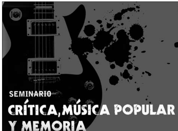
Imagen 5. Afiche 40 años del rock en Chile, 2006

Cuando millones de adolescentes blancos transgredieron las reglas del apartheid norteamericano, comprando discos de rhythm and blues , una música «de negros», produjeron un volumen de ventas mucho mayor al generado por el resto de la edades. A partir de entonces, las compañías discográficas comenzarían a otorgarle importancia primordial a la juventud como mercado (Carlin, 1993:20).