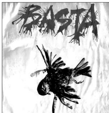
Imagen 6. Carátula de LP de Quilapayún «Basta», Santiago, 1969

Como si la fuerza del rojinegro no fuera suficiente, el afiche chileno es impactado con manchas de tinta negra, que parecen las huellas de un sonido perturbador, asociado a la guitarra eléctrica que domina el diseño. Estas manchas recuerdan las de la impactante carátula, también rojinegra, del LP Basta de Quilapayún, editado por DICAP en 1969, que incluye La muralla de Nicolás Guillén y Quilapayún, y La carta , de Violeta Parra, dos clásicos del cancionero comprometido chileno de los años sesenta.