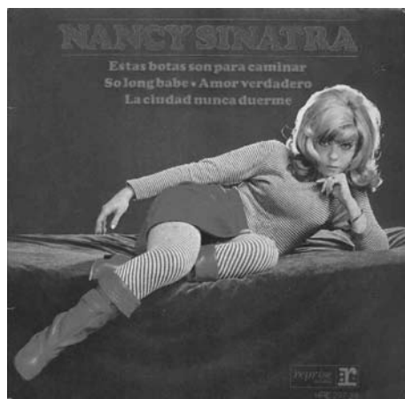
Imagen 2. Carátula del disco Estas botas están hechas para caminar sobre ti de Nancy Sinatra

De este modo, el rock chileno intenta ser moderno desde la periferia, pero no lo logra del todo. La juventud chilena ha sufrido el freno que se le aplicó al primer rock and roll , y bajo los escombros del proyecto inicial empiezan a surgir grupos que tratan de avanzar, pero adaptándose a los requerimientos de un medio que, paradójicamente, tenderá a ignorarlos. Lo que resulta evidente en este análisis, es que dentro del propio impulso modernizador del rock de mediados de los años sesenta, se mira hacia los años de oro del rock and roll , que nutre a las grandes estrellas internacionales y nacionales del género.