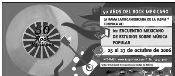
Imagen 3. Afiche 50 años del rock en México, 2006

La presencia de tres tocadiscos portátiles o pickups en el afiche, enfatiza los cincuenta años del rock desde la perspectiva de la escucha. Lo que cuenta, entonces, es el uso, el consumo y la (re)significación local de un fenómeno internacional. Con el tocadiscos portátil, se inicia un tipo de audición independiente, que empiezan a realizar los (pre)adolescentes con un aparato económico, liviano y modular, que podían instalar con facilidad en sus dormitorios, muchas veces en el suelo. Por primera vez, los jóvenes podían sustraerse a la dominación paterna sobre el espacio sonoro doméstico, ejercida desde el control del gran equipo de música instalado en el living de la casa.