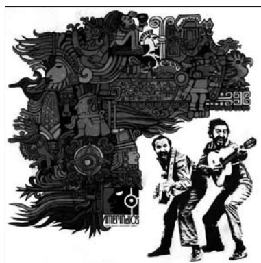
Imagen 7. Portada del LP Amerindios, Santiago, 1970