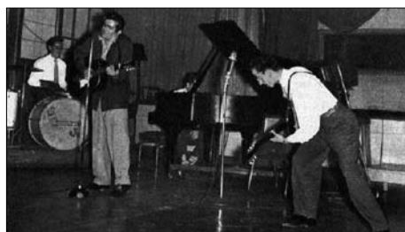
Imagen 11. William Reb and His Rock Kings, Valparaíso, 1956

Las propias boites y quintas de recreo se abrieron a la tendencia del rock and roll . El caso de la confitería, salón de té y boite Goyescas (1949-1963) resulta especialmente interesante, debido a que fue la última de las grandes boites del centro de Santiago en mantener abiertas sus puertas. Ubicada en la céntrica esquina de Estado con Huérfanos, y escenario habitual de la música española, el tango, el bolero, el swing , la música tropical, y el folklore, el Goyescas contrató al menos tres bandas de rock and roll entre 1957 y 1958: William Reb and His rock Kings; The rock Time; y los aún afamados Bill Haley and His Comets. Las dos primeras eran bandas de Valparaíso.