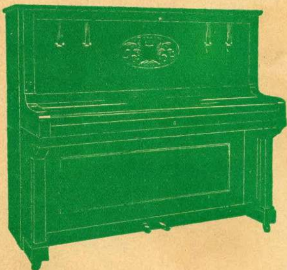
Altura 1.33 Ancho 1.52 Profundidad 0.68 m. Clavijero metálico — Elegante construcción